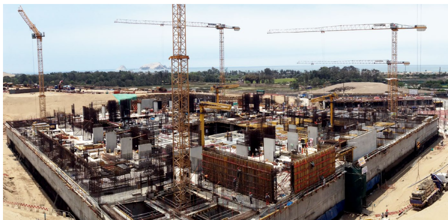
El Museo Nacional (MUNA) es actualmente la obra de infraestructura cultural más importante del Perú con miras al bicentenario.

pública y apoya el manejo eficiente del presupuesto público, de acuerdo con las estrategias de desarrollo del Perú y el Marco de Asistencia de las Naciones Unidas para el Desarrollo (UNDAF, 2017-2021).